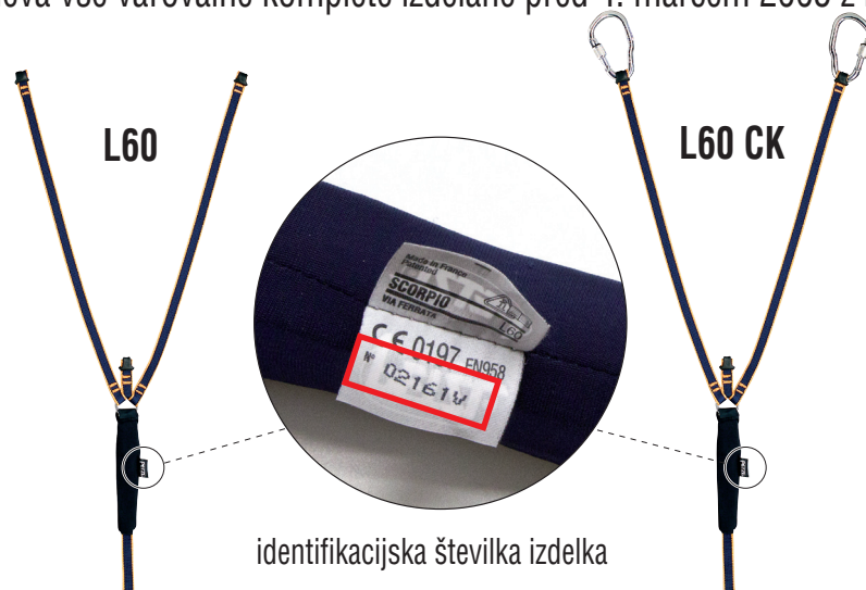
identifikacijska številka izdelka

Zadeva vse varovalne komplete izdelane pred 4. marcem 2005 z identifikacijskimi številkami od 02150 do 05062.